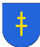
Zenon Janus Starosta Powiatu Kieleckiego