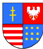
Bożentyna Pałka-Koruba Wojewoda Świętokrzyski